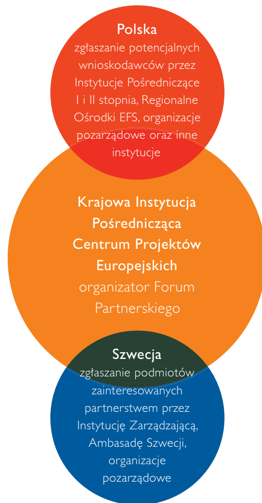
Schemat organizacyjny Forum Partnerskiego

narodowej jest uzależniona od stworzenia przez partnerów solidnej bazy do przyszłej współpracy, opartej na dobrej komunikacji i jasnym sprecyzowaniu wzajemnych oczekiwań obu stron, zwłaszcza w odniesieniu do kwestii finansowania, jeszcze przed rozpoczęciem realizacji projektu. W związku z tym na jesień bieżącego roku zaplanowano przygotowanie wspólnego polsko-szwedzkiego Forum Partnerskiego w Warszawie, którego organizacją zajmie się Krajowa Instytucja Wspomagająca, we współpracy z Instytucjami Pośredniczącymi. Na spotkanie zostaną zaproszone wybrane podmioty polskie i szwedzkie realizujące projekty z obszaru EFS. W trakcie forum będzie miejsce na prezentację własnych zamierzeń dotyczących współpracy ponadnarodowej, nawiązanie kontaktów i omówienie ewentualnej dalszej współpracy. Istnieje duża szansa, że forum zaowocuje realizacją ciekawych projektów współpracy ponadnarodowej PO KL zarówno w Polsce, jak i w krajach biorących udział we współpracy. •